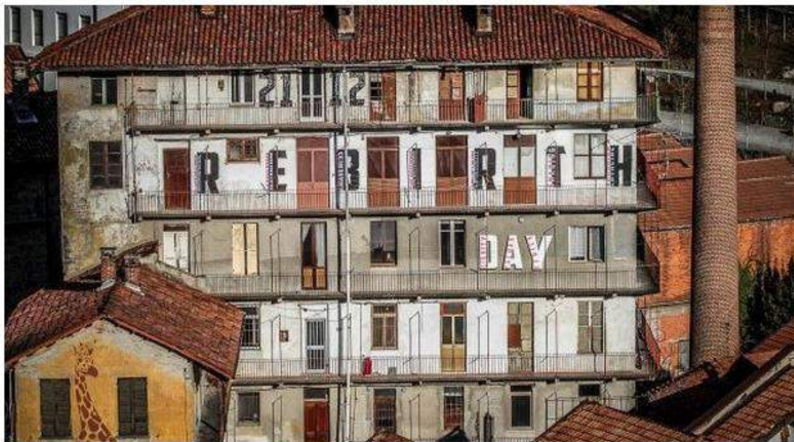
Biella fondazione Pistoletto