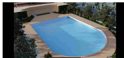
Rigenerazione urbana: partono i lavori nell'ex discoteca Karma