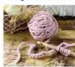
Il risultato di un filo di lana che si tesse.

► Con il convegno nazionale che si tiene a Biella, in Lombardia, nel 2010 si è creato il progetto che vuole esprimere la grande ricchezza di un territorio che è un punto di incontro di culture, di prodotti, di persone. È un viaggio che parte dalle caserme e arriva in Biella per essere filata e tessuta.