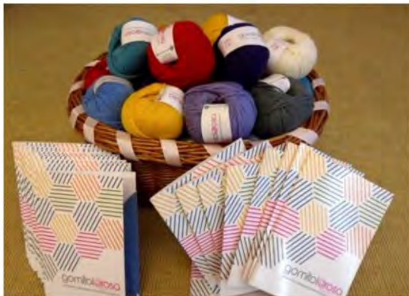
I gomitoli di Gomitolorosa

A Villa Ada il discorso fila: arriva la quinta edizione della festa del lavoro a maglia di Gomitolorosa. Il 10 giugno, nella storica villa dalle 11 alle 18, adulti e bambini potranno cimentarsi nella realizzazione di astucci e altri piccoli oggetti.