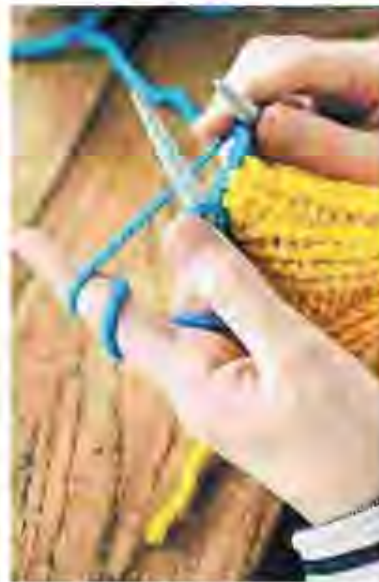
Il lavoro a maglia

A sostenere l'iniziativa che prevede la distribuzione di specifici "kit" personali per questo supporto alle cure, sono i fondi dei bandi Gilead del Com-