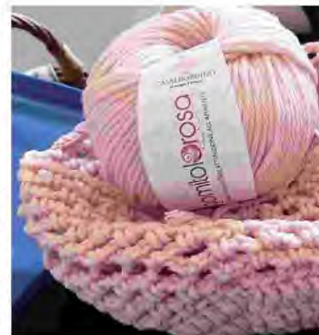
Il simbolo dell'Associazione

giochi di parole simpatici e divertenti, soprattutto in Irlanda, giocando sul doppio significato dello stesso suono: how are ewe? Nice to see ewe! Contrariamente al suo equivalente nelle altre nostre lingue, oveja in spagnolo, mouton in francese, ovca in croato, pecora in italiano, probato in greco, ecc., ewe è una parola molto semplice e facile da pronunciare e, soprattutto, poteva a